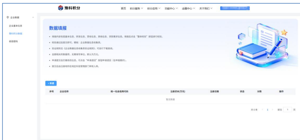
图1.豫科积分数据填报

科技企业用户可通过平台（网址： https://ykjf.hnkjfw.cn/layout/login ）登录，点击网站右上角“用户名称-个人中心—企业数据-豫科积分数据”查看“豫科积分”数据填报模块，如图 1。